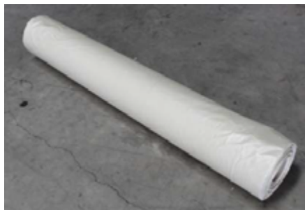
Filme de cobertura