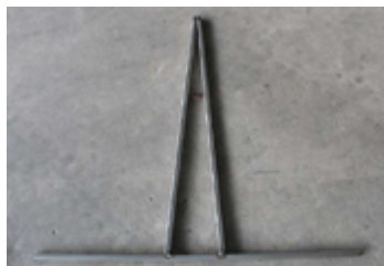
Hastes de metalon