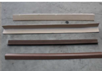
Cantoneiras de madeira