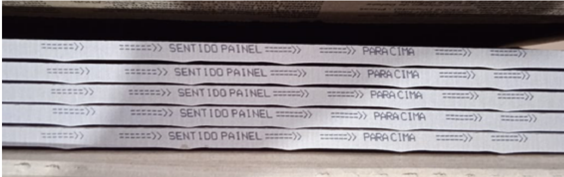
Figura 2 - Orientação da seta de assentamento na lateral da peça