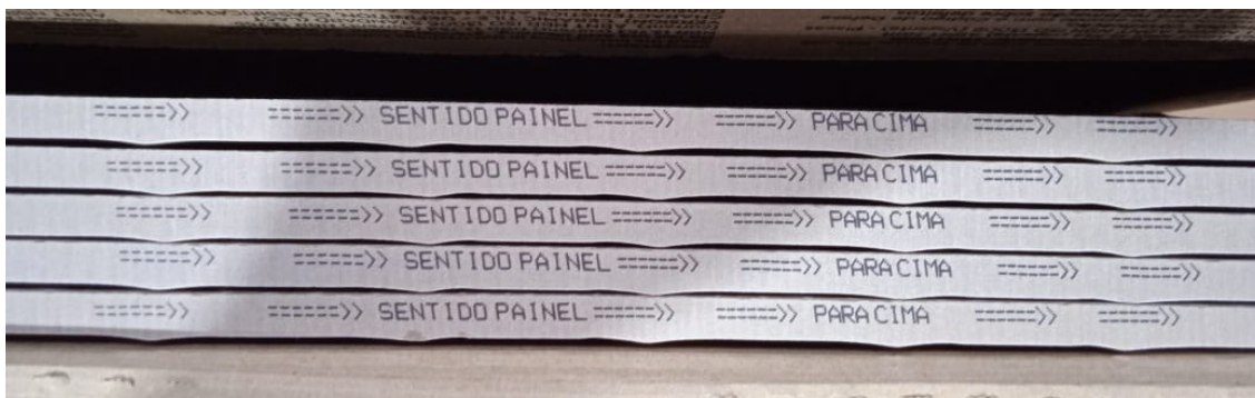
Figura 2 - Orientação da seta de assentamento na lateral da peça